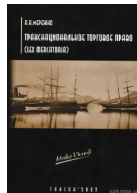
Транснаціональне торговельне право (Lex mercatoria)