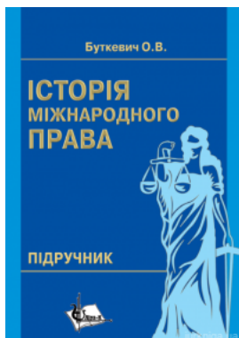
Історія міжнародного права