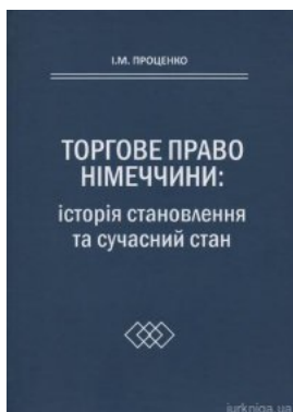
Торговельне право Німеччини: історія та сучасний стан