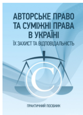
Авторське право та суміжні права в Україні. Їх захист та відповідальність