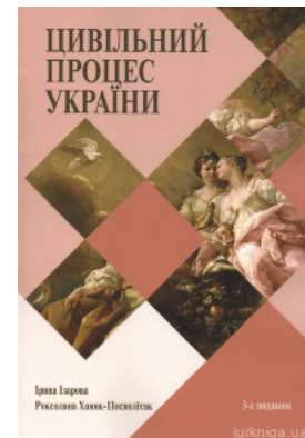
Цивільний процес України. Навчальний посібник для студентів юридичних спеціальностей закладів вищої освіти