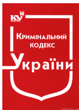
Кримінальний кодекс України