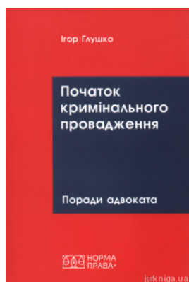
Початок кримінального провадження: поради адвоката