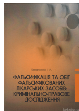
Фальсифікація та обіг фальсифікованих лікарських засобів: кримінально-правове дослідження

Перейти до галузі права Кримінальне право та процес