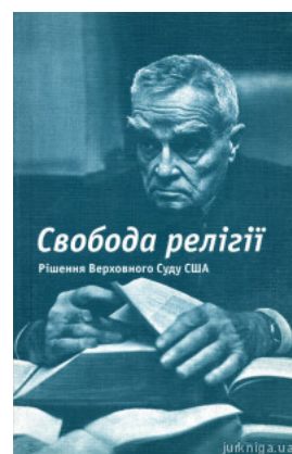
Свобода релігії. Рішення Верховного Суду США