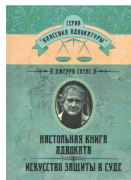
Настольная книга адвоката. Искусство защиты в суде