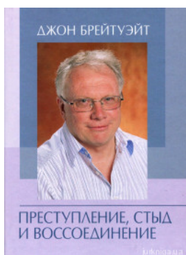
Преступление, стыд и воссоединение