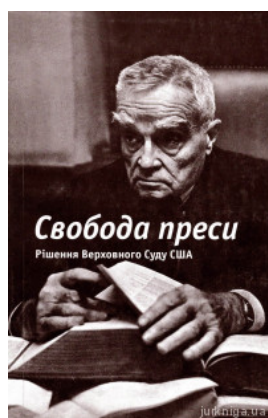
Свобода преси. Рішення Верховного Суду США