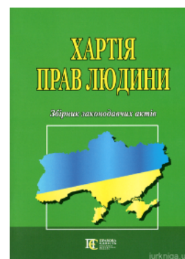
Хартія прав людини. Збірник законодавчих актів. Алерта