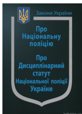
Закон України "Про Національну поліцію", "Про дисциплінарний статут Національної поліції України"