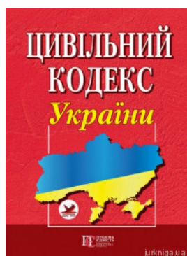
Цивільний кодекс України. Алерта