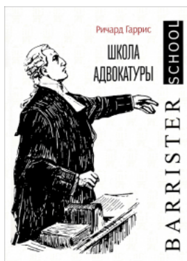
Школа адвокатуры. Руководство к ведению гражданских и уголовных дел