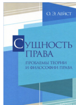
Сущность права. Проблемы теории и философии права