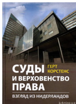
Суды и верховенство права: взгляд из Нидерландов