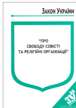
Закон України "Про свободу совісті та релігійні організації"