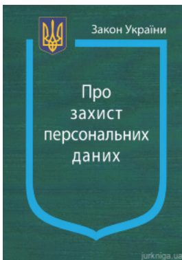
Закон України "Про захист персональних даних"