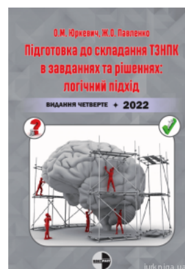
Підготовка до складання ТЗНПК в завданнях та рішеннях: логічний підхід