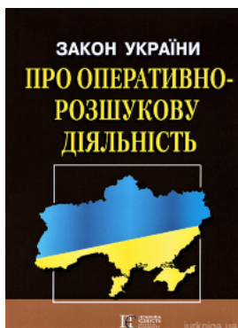
Закон України "Про оперативно-розшукову діяльність". Алерта

Перейти до галузі права Інформаційне право