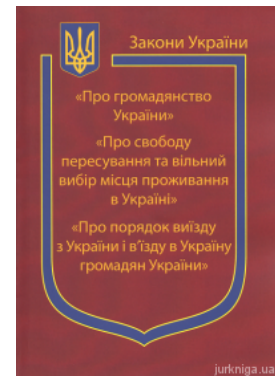
Закони України "Про громадянство України", "Про свободу пересування та вільний вибір місця проживання в Україні", "Про порядок виїзду з України і вїзду в Україну громадян України..."