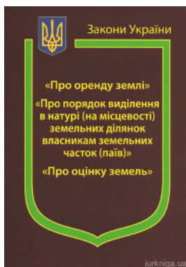
Закони України "Про оренду землі", "Про порядок виділення в натурі (на місцевості) земельних ділянок власникам земельних часток (паїв)", "Про..."