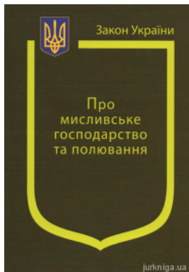
Закон України "Про мисливське господарство та полювання"