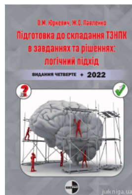
Підготовка до складання ТЗНПК в завданнях та рішеннях: логічний підхід