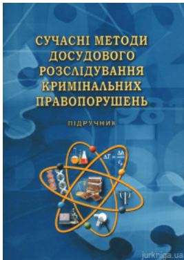
Сучасні методи досудового розслідування кримінальних правопорушень