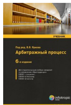
Арбитражный процесс: учебник