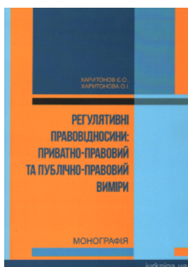
Регулятивні правовідносини: приватно-правовий та публічно-правовий виміри