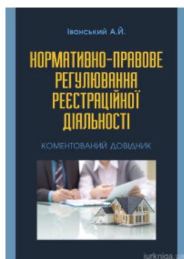
Нормативно-правове регулювання реєстраційної діяльності. Коментований довідник