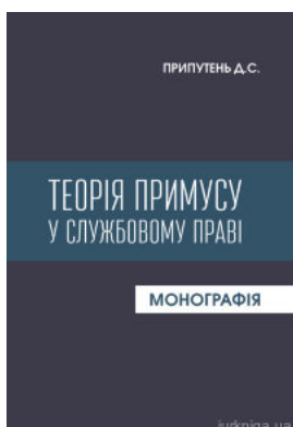
Теорія примусу в службовому праві