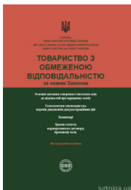
Товариство з обмеженою відповідальністю за новим законом

Перейти до галузі права Інтелектуальна власність