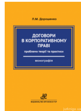
Договори в корпоративному праві: проблеми теорії та практики