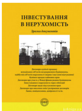
Інвестування в нерухомість: зразки документів