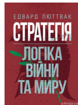
Стратегія: логіка війни та миру

Перейти до галузі права Нотаріальне право