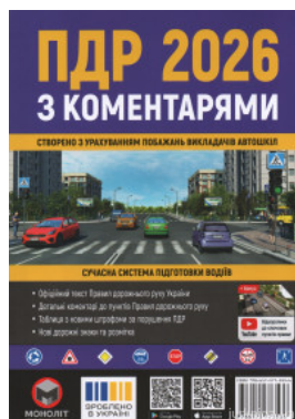
ПДР України 2026 з коментарями