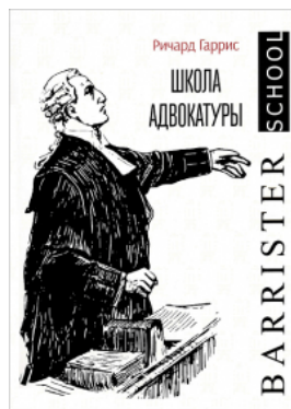
Школа адвокатури. Руководство к ведению гражданских и уголовных дел