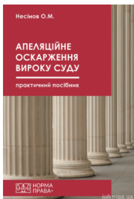
Апеляційне оскарження вироку суду. Практичний посібник