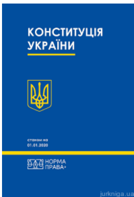
Конституція України. Норма права