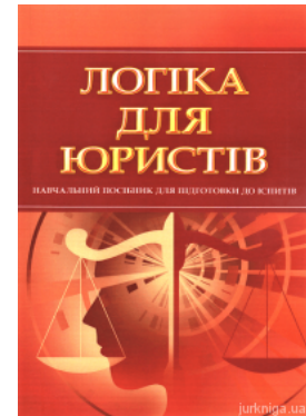
Логіка для юристів. Навчальний посібник для підготовки до іспитів