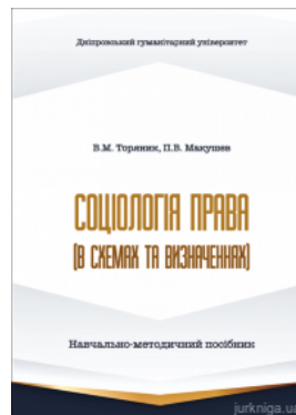
Соціологія права (в схемах та визначеннях). Навчально-методичний посібник