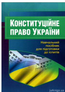
Конституційне право України. Навчальний посібник для підготовки до іспитів