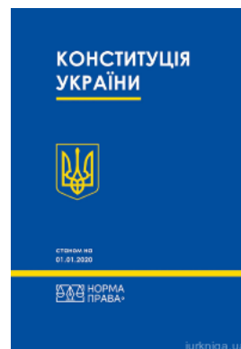
Конституція України. Норма права

Перейти до галузі права История государства и права