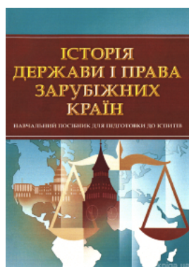
Історія держави і права зарубіжних країн. Навчальний посібник для підготовки до іспитів