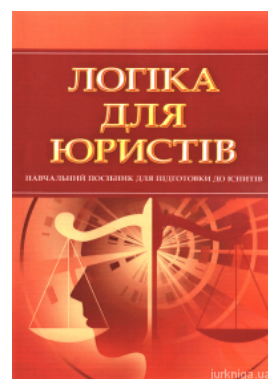
Логіка для юристів. Навчальний посібник для підготовки до іспитів