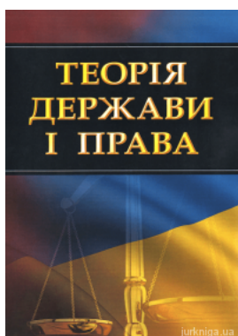
Теорія держави і права. Навчальний посібник для підготовки до іспитів