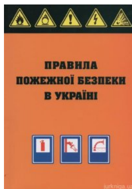
Правила пожежної безпеки в Україні