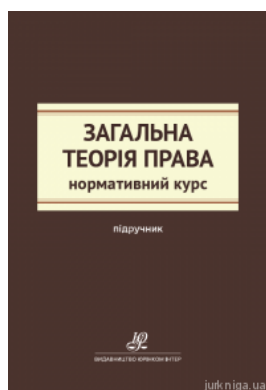
Загальна теорія права. Нормативний курс