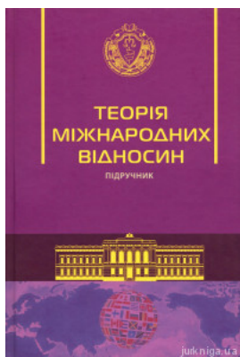
Теорія міжнародних відносин