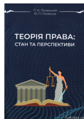
Теорія права: стан та перспективи