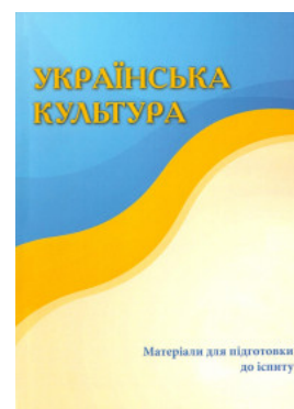
Українська культура. Матеріали для підготовки для іспиту