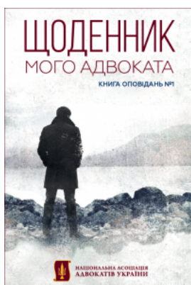
Щоденник мого адвоката. Книга оповідань №1

Перейти до галузі права Історія держави та права