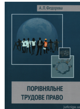
Порівняльне трудове право