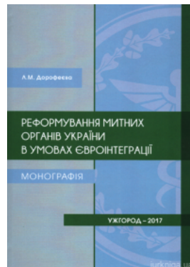
Реформування митних органів України в умовах євроінтеграції