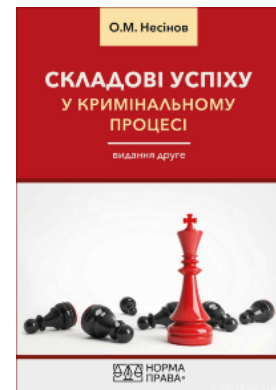
Складові успіху у кримінальному процесі. Видання друге

Перейти до галузі права Кримінальное право и процесс