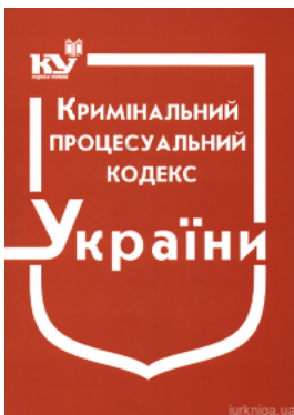
Кримінальний процесуальний кодекс України