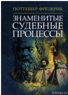
Знаменитые судебные процессы