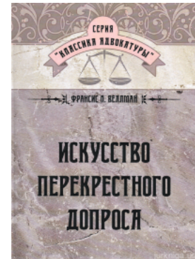
Искусство перекрестного допроса