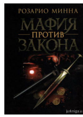
Мафия против закона