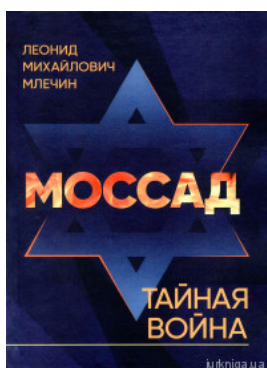
Моссад. Тайная война