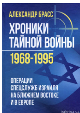
Хроники тайной войны 1968-1995. Операции спецслужб Израиля на Ближнем Востоке и в Европе