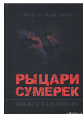
Рыцари сумерек. Тайны спецслужб мира