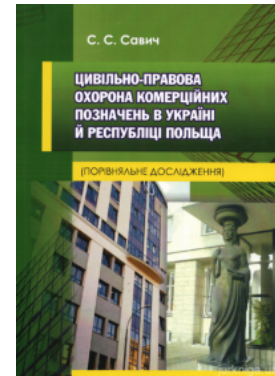
Цивільно-правова охорона комерційних позначень в Україні й Республіці Польща