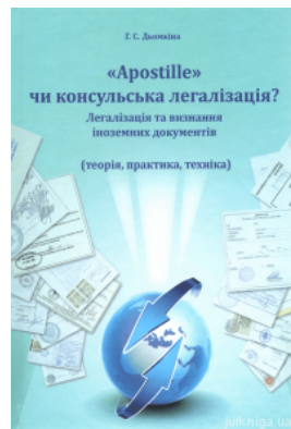
Apostille чи консульська легалізація? Легалізація та визнання іноземних документів (теорія, практика, техніка)