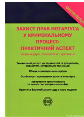
Захист прав нотаріуса у кримінальному процесі: практичний аспект