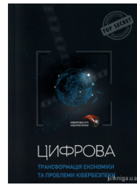
Цифрова трансформація економіки та проблеми кібербезпеки