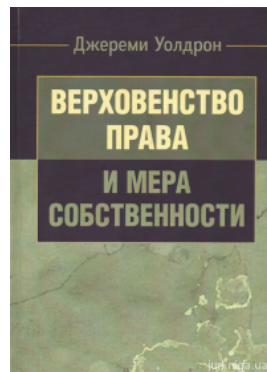
Верховенство права и мера собственности