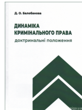
Динаміка кримінального права: доктринальні положення