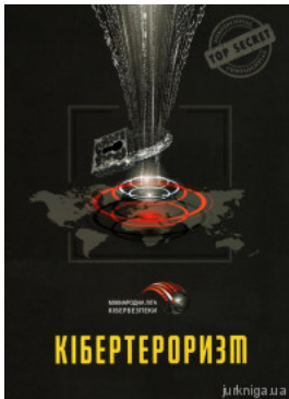
Кібертероризм: історія, цілі, об'єкти. Практичний посібник