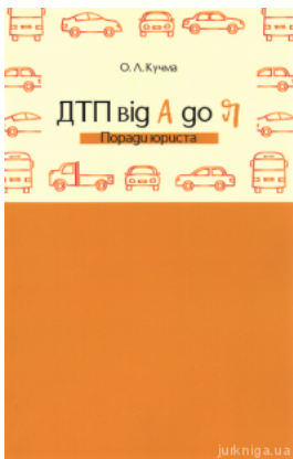
ДТП від А до Я. Поради юриста