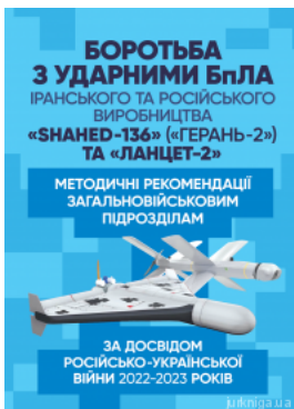
Боротьба з ударними БПЛА іранського та російського виробництва «Shahed-136» («Герань-2») та «Ланцет-2». Методичні рекомендації загальновійськовим...