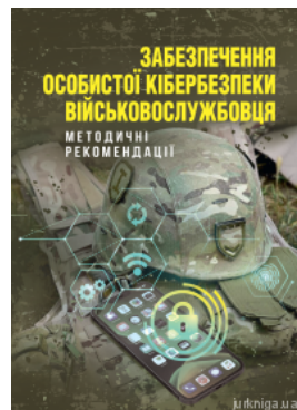
Забезпечення особистої кібербезпеки військовослужбовця