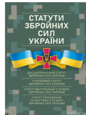
Статут збройних сил України

Перейти до галузі права Інформаційне право