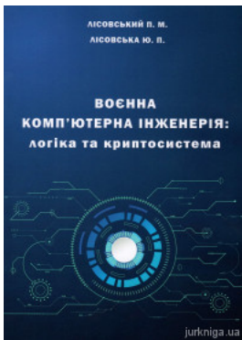
Воєнна комп'ютерна інженерія: логіка та криптосистема