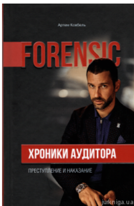
Хроники аудитора. Форензик - преступление и наказание