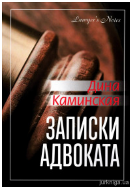
Записки адвоката. Дина Каминская