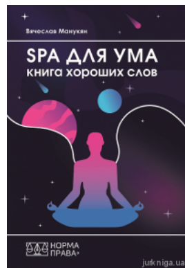
SPA для ума. Книга хороших слов