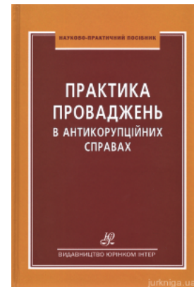
Практика проваджень в антикорупційних справах