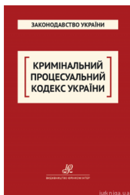
Кримінальний процесуальний кодекс України. Юрінком Інтер