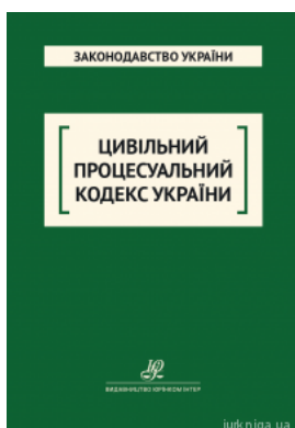
Цивільний процесуальний кодекс України. Юрінком Інтер