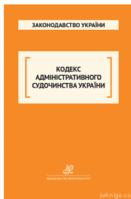
Кодекс адміністративного судочинства України. Юрінком Інтер