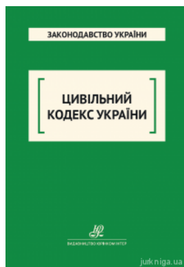
Цивільний кодекс України. Юрінком Інтер