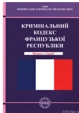
Кримінальний кодекс Французької Республіки