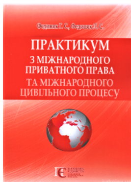
Практикум з міжнародного приватного права та міжнародного цивільного процесу