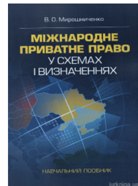
Міжнародне приватне право у схемах і визначеннях

Перейти до галузі права Міжнародне приватне право