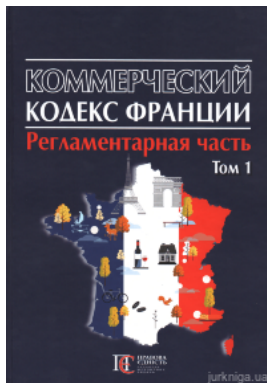
Коммерческий кодекс Франции. Регламентарная часть. Том 1