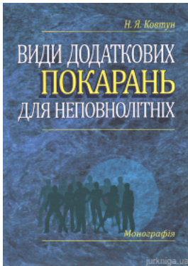
Види додаткових покарань для неповнолітніх: монографія