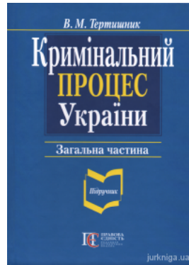
Кримінальний процес України. Загальна частина