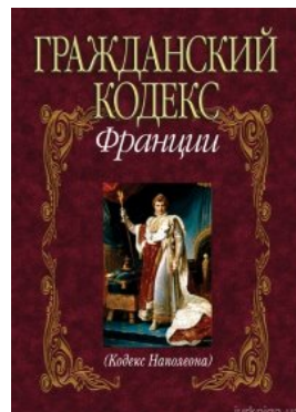
Гражданский кодекс Франции (Кодекс Наполеона)