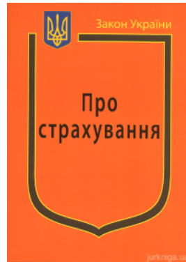
Закон України "Про страхування"