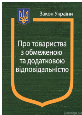
Закон України «Про товариства з обмеженою та додатковою відповідальністю»