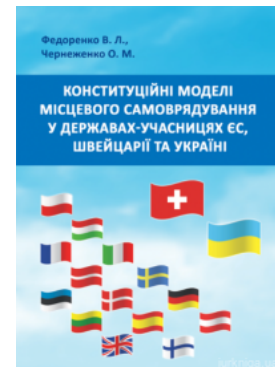
Конституційні моделі місцевого самоврядування та управління в державах-учасницях ЄС, Швейцарії та Україні