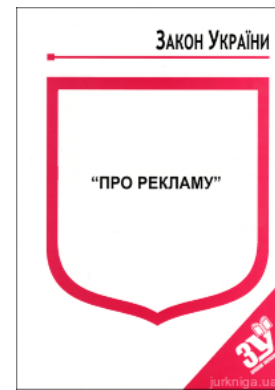
Закон України "Про рекламу"

Перейти до галузі права Конституційне право