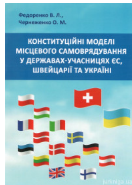
Конституційні моделі місцевого самоврядування у державах-учасницях ЄС, Швейцарії та Україні