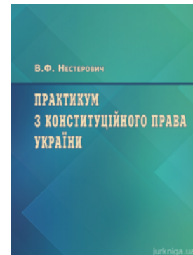
Практикум з Конституційного права України