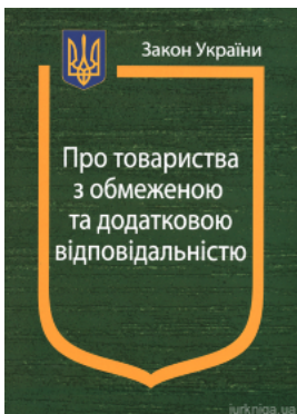
Закон України «Про товариства з обмеженою та додатковою відповідальністю»