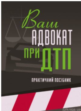
Ваш адвокат при ДТП