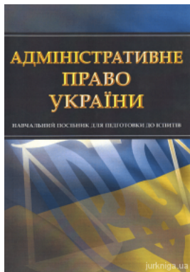
Адміністративне право України. Навчальний посібник для підготовки до іспитів