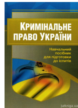
Кримінальне право України. Навчальний посібник для підготовки до іспитів

Перейти до галузі права Конституційне право