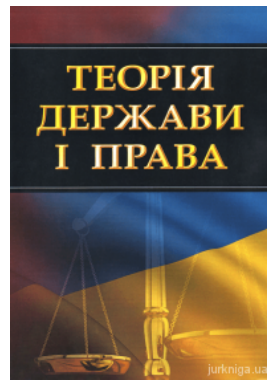
Теорія держави і права. Навчальний посібник для підготовки до іспитів