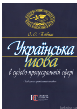
Українська мова в судово-процесуальній сфері. Навчально-практичний посібник. Видання друге