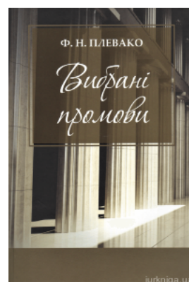
Вибрані промови. Ф.Н. Плевако

Перейти до галузі права Конституционное право