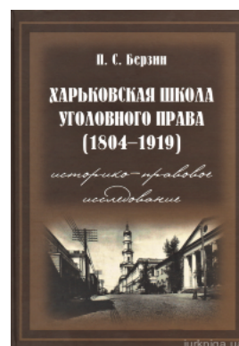
Харьковская школа уголовного права (1804 - 1919 годы): историко-правовое исследование. Том 1