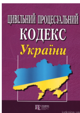
Цивільний процесуальний кодекс України. Алерта