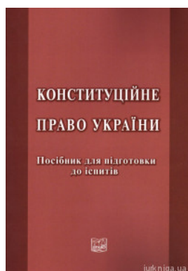
Конституційне право України. Посібник для підготовки до іспитів