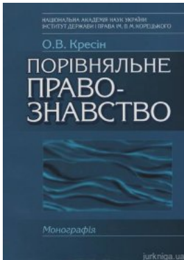
Порівняльне правознавство. Монографія