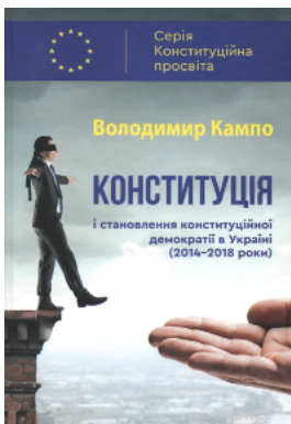
Конституція і становлення конституційної демократії в Україні (2014-2018 роки)

Перейти до галузі права Конституційне право