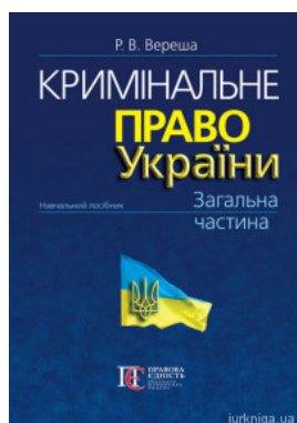
Кримінальне право України. Загальна частина. Видання 10-те