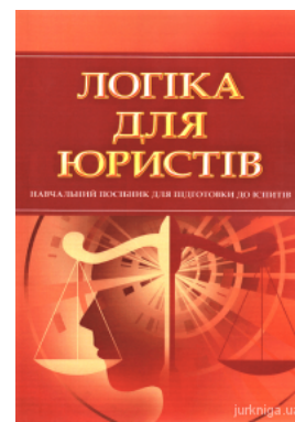
Логіка для юристів. Навчальний посібник для підготовки до іспитів

Перейти до галузі права Конституційне право