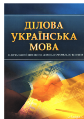
Ділова українська мова. Навчальний посібник для підготовки до іспитів