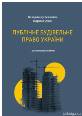
Публічне будівельне право України