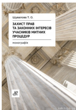
Захист прав та законних інтересів учасників митних процедур