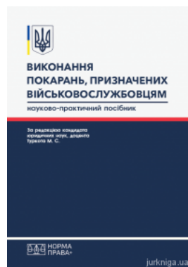
Виконання покарань, призначених військовослужбовцям

Перейти до галузі права Конституційне право