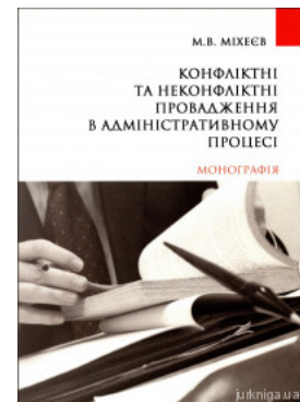
Конфліктні та неконфліктні провадження в адміністративному процесі

Перейти до галузі права Конституційне право