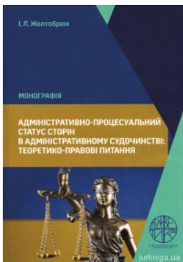
Адміністративно-проце суальний статус сторін в адміністративному судочинстві: теоретико-правові питання