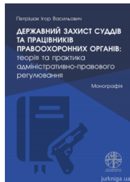
Державний захист суддів та працівників правоохоронних органів: теорія та практика адміністративно-право вого регулювання