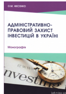
Адміністративно-право вий захист інвестицій в Україні