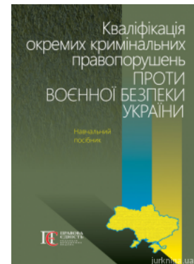
Кваліфікація окремих кримінальних правопорушень проти воєнної безпеки України