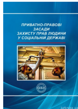
Приватно-правові засади захисту прав людини у соціальній державі