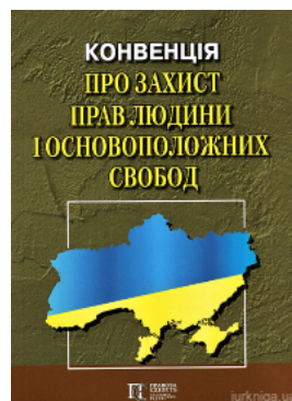
Конвенція про захист прав людини і основоположних свобод. Збірник законодавчих актів. Алерта