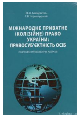
Міжнародне приватне (колізійне) право України: правосуб'єктність осіб (теоретико-методологічні аспекти)