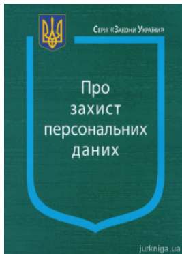
Закон України "Про захист персональних даних"