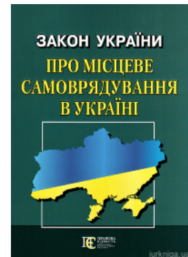
Закон України "Про місцеве самоврядування в Україні". Алерта