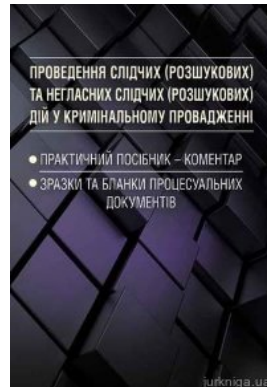
Проведення слідчих (розшукових) та негласних слідчих (розшукових) дій у кримінальному провадженні