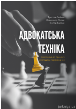
Адвокатська техніка (підготовка до процесу і методики переконання)