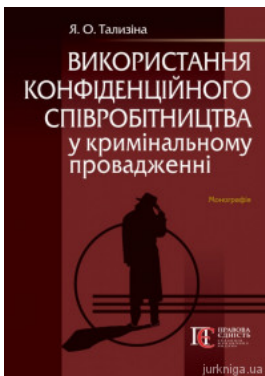
Використання конфіденційного співробітництва у кримінальному провадженні