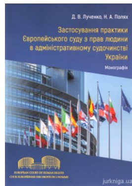
Застосування практики Європейського суду з прав людини в адміністративному судочинстві України