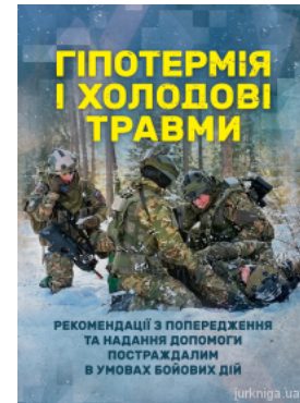
Гіпотермія і холодові травми. Рекомендації з попередження та надання допомоги постраждалим в умовах бойових дій