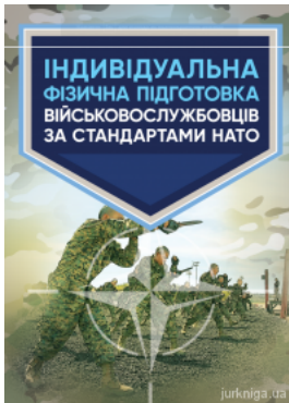
Індивідуальна фізична підготовка військовослужбовців за стандартами НАТО