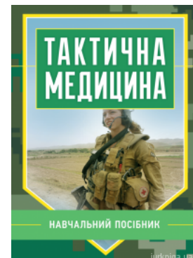
Тактична медицина. Навчальний посібник