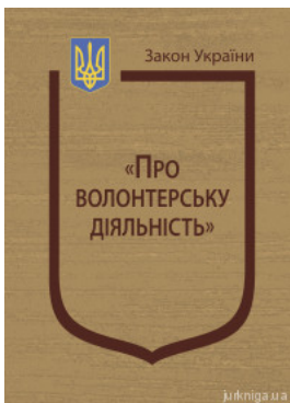
Закон України "Про волонтерську діяльність"