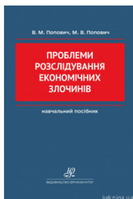
Проблеми розслідування економічних злочинів