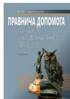
Правнича допомога та захист у кримінальному процесі