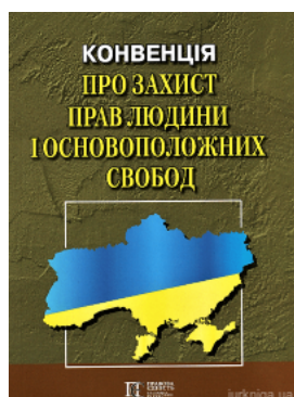
Конвенція про захист прав людини і основоположних свобод. Збірник законодавчих актів. Алерта