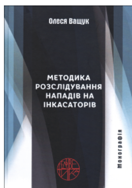
Методика розслідування нападів на інкасаторів