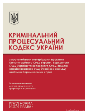
Кримінальний процесуальний кодекс України з постатейними матеріалами практики Конституційного Суду України, Верховного Суду України та Верховного...