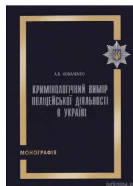
Кримінологічний вимір поліцейської діяльності в Україні

Перейти до галузі права Кримінальное право и процесс