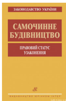
Самочинне будівництво. Правовий статус. Узаконення