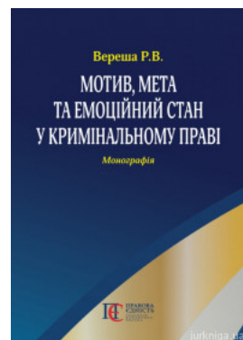
Мотив, мета та емоційний стан у кримінальному праві

Перейти до галузі права Кримінальне право та процес