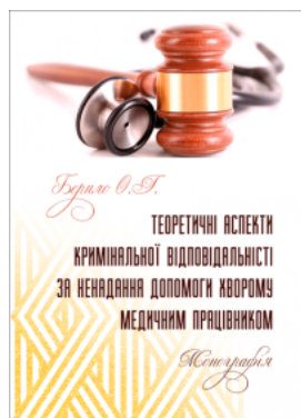
Теоретичні аспекти кримінальної відповідальності за ненадання допомоги хворому медичним працівником