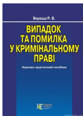
Випадок та помилка у кримінальному праві