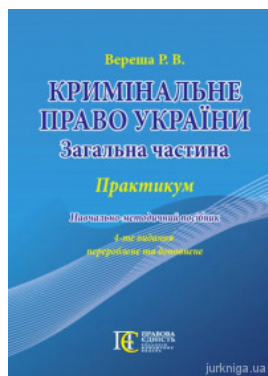
Кримінальне право України (Загальна частина). Практикум