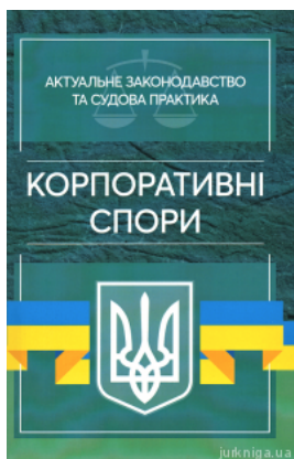
Корпоративні спори. Актуальне законодавство та судова практика