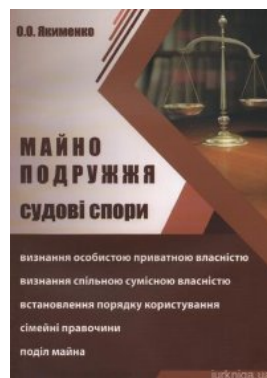
Майно подружжя. Судові спори