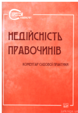
Недійсність правочинів. Коментар судової практики