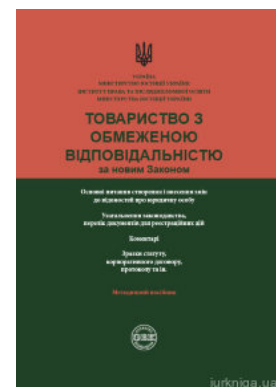
Товариство з обмеженою відповідальністю за новим законом

Перейти до галузі права Корпоративне право