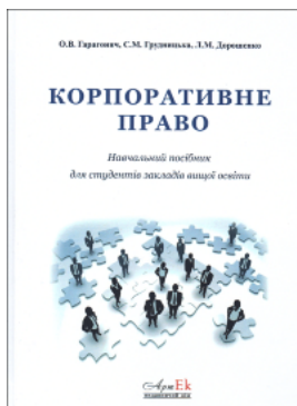
Корпоративне право: навчальний посібник