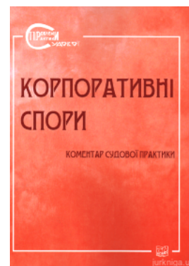
Корпоративні спори. Коментар судової практики

Перейти до галузі права Корпоративне право