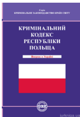
Кримінальний кодекс Республіки Польща