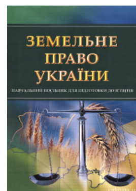
Земельне право України. Навчальний посібник для підготовки до іспитів

Перейти до галузі права Корпоративне право